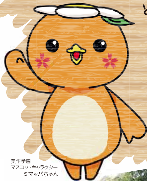
美作学園 マスコットキャラクター ミマッパちゃん